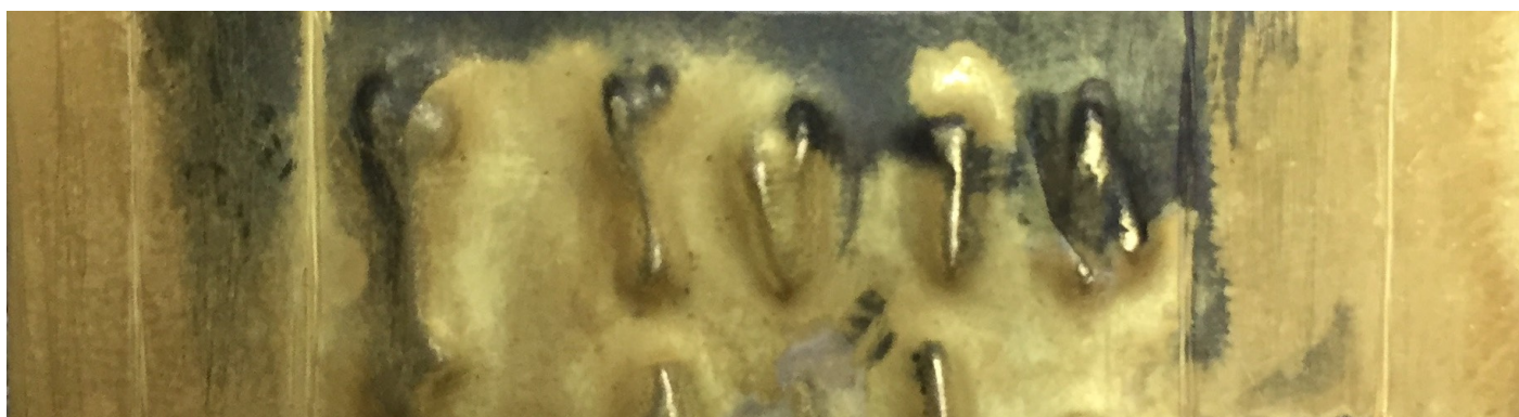
Détails, exposition « Subarnarekha » de Hemali BHUTA, Centre d'art de Vassivière, 2017.

3 décembre 2017 - 11 mars 2018 Vernissage samedi 2 décembre 2017 à 16h30