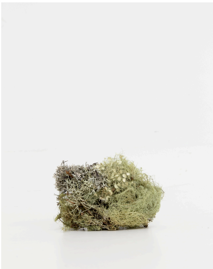
François Génot et Alexis Zimmer Histoires naturelles .