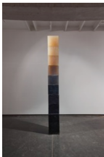
Hemali Bhuta, Grayscale (2012) Savon à la glycérine, colorants alimentaires, barres et plaques en acier inoxydable 30 x 30 cm x 10 éléments